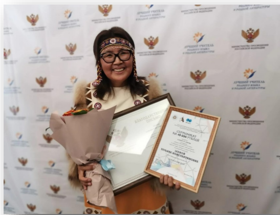
Камчатка, Ковран, школа...